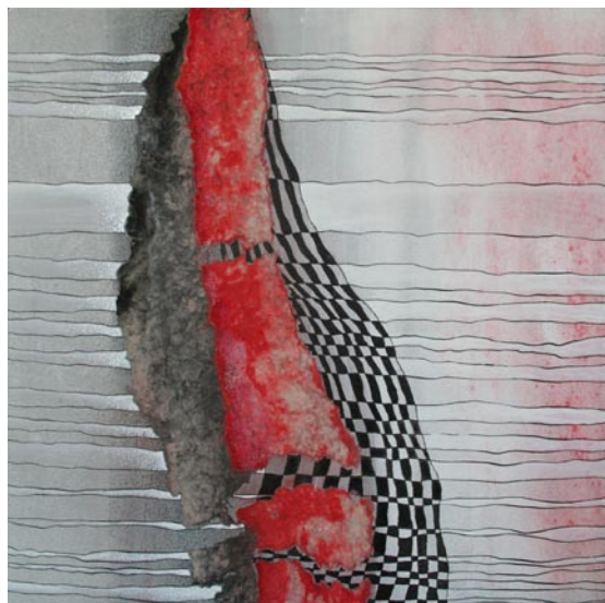
Mischtechnik auf Holz

DI 8. April Vernissage 18 bis 21 Uhr MI bis FR Öffnungszeiten 12 bis 20 Uhr SA 12. April Finissage 12 bis 19 Uhr